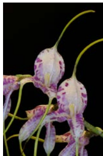
Masdevallia polysticta Herkomst: Ecuador - Peru Temperatuur: gematigd Bloem: 3 cm Verzorging: geen rust, gehele jaar door regelmatig water, geen zonlicht