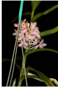
Ascocentrum christensonianum Herkomst: Thailand Temperatuur: gematigd Bloem: 1 - 1,5 cm Verzorging: geen rust, gehele jaar door water licht geschermd plaats