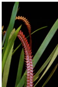
Dendrochillum saccolabium Herkomst: Filippijnen Temperatuur: gematigd Bloem: 1 cm Verzorging: geen rust, gehele jaar door regelmatig water, geen zonlicht