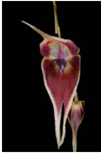
Lepanthes cloesii Herkomst: Peru Temperatuur: gematigd Bloem: 2 - 3 cm Verzorging: geen rust, gehele jaar door regelmatig water, geen zonlicht