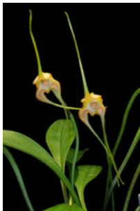
Masdevallia norops Herkomst: Ecuador Temperatuur: gematigd Bloem: 15 cm Verzorging: geen rust, gehele jaar door regelmatig water, geen zonlicht