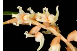
Dendrochillum anfractum Herkomst: Filippijnen Temperatuur: gematigd Bloem: 1 cm Verzorging: geen rust, gehele jaar door regelmatig water, geen zonlicht