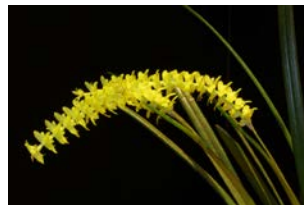
Dendrochillum javieriense Herkomst: Filippijnen Temperatuur: gematigd Bloem: 1 cm Verzorging: geen rust, gehele jaar door regelmatig water, geen zonlicht