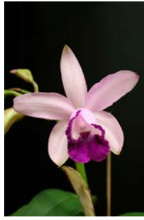
Cattleya intermedia var. orlata Herkomst: Brazilië Temperatuur: gematigd Bloem: 10 cm Verzorging: geen rust, gehele jaar door regelmatig water, veel licht