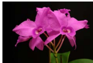
Cattleya skinnerii Herkomst: Midden Amerika Temperatuur: gematigd Bloem: 10 cm Verzorging: geen rust, gehele jaar door regelmatig water, veel licht