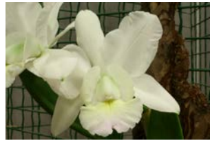
Cattleya dolosa var. alba Herkomst: Brazilië Temperatuur: gematigd Bloem: 10 cm Verzorging: geen rust, gehele jaar door regelmatig water, veel licht