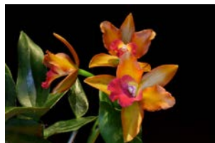
Cattleya LC Laagtone