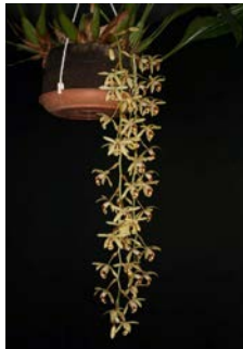
Coelogyne tomentosa Herkomst: Azië Cultuur: gematigd/warm