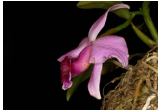
Laelia praestans Herkomst: Brazilië Cultuur: koud/gematigd