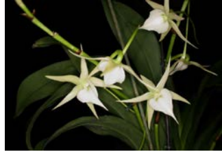
Angreacum Veitchii Herkomst: hybride Cultuur: gematigd/warm