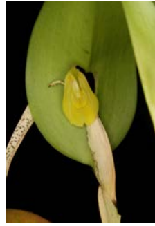
Restrepia flosculata var. alba Herkomst: Ecuador, Colombia Cultuur: gematigd