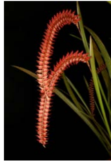
Dendrochillum saccolabium Herkomst: Filippijnen Cultuur: gematigd