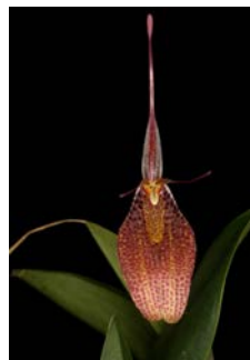
Restrepia specie (guttulata) Herkomst: Z-Amerika Cultuur: gematigd