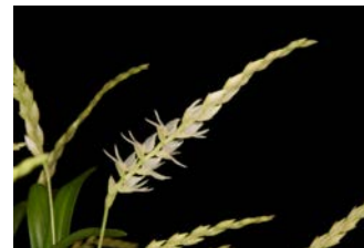
Dendrochillum specie klein (D. parvulum?) Herkomst: Philippijnen Cultuur: gematigd