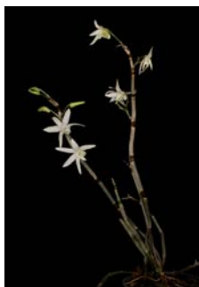
Dendrobium moniliforme Herkomst: Taiwan Cultuur: gematigd,