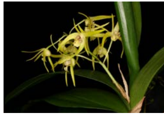
Dendrobium speciosum x tetragonum Herkomst: hybride Cultuur: gematigd/koud,