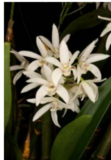
Dendrobium falcorostrum Herkomst: Australië Cultuur: gematigd/koud