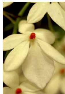
Aerangis luteo-alba var. rhodosticta Herkomst: Africa Cultuur: gematigd