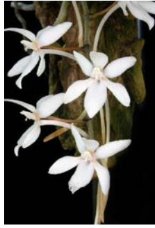
Aerangis mystacidiis Herkomst: Africa Cultuur: gematigd