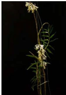
Dendrobium apanochilum Herkomst: Z.O. Azie Cultuur: gematigd