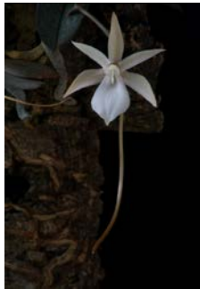
Aerangis punctata Herkomst: Madagascar Cultuur: gematigd