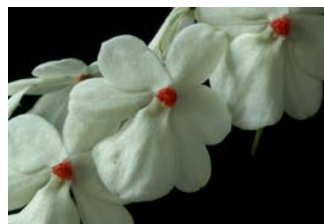
Aerangis luteo-alba var. rhodosticta Herkomst: Africa Cultuur: gematigd