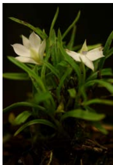
Dendrobium subuliferum Herkomst: Papua Nieuw Guinea Cultuur: gematigd/koud