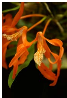
Dendrobium lamyiae Herkomst: Thailand - Myamar Cultuur: gematigd