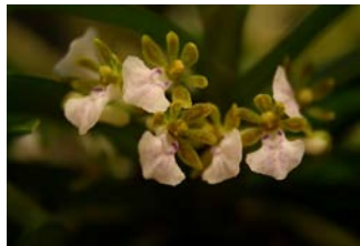
Trichoglottis triflora Herkomst: Filippijnen Cultuur: gematigd