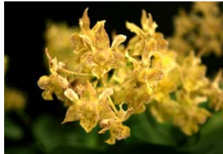
Dendrobium aberrans x polysema Herkomst: hybride Cultuur: gematigd