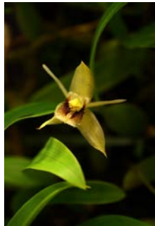
Coelogyne fimbriata Herkomst: Z.O. Azië Cultuur: gematigd/koud