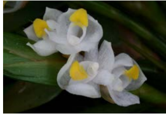
Maxillaria neglecta Herkomst: Midden Amerika Cultuur: gematigd