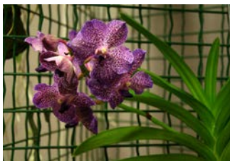
Vanda hybride Herkomst: hybride Cultuur: gematigd-warm