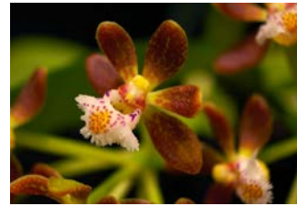
Gastrochilus acutifolius Herkomst: Azië Cultuur: gematigd