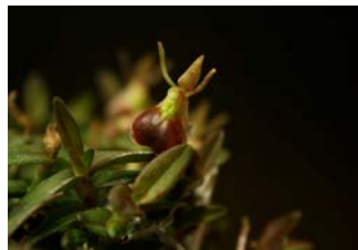
Epidendrum porpax Herkomst: Midden en Zuid Amerika Cultuur: gematigd