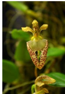
Bulbophyllum lasiohilum Herkomst: Azie Cultuur: gematigd