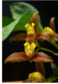
Lycaste lasioglossa Herkomst: Guatemala Cultuur: gematigd