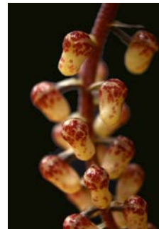
Eria robusta Herkomst: Borneo-Sarawak Cultuur: gematigd-warm