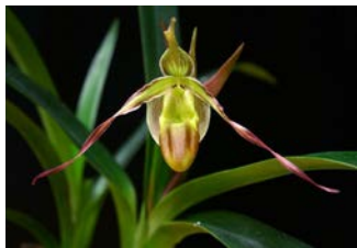
Phragmipedium longifolium Herkomst: Guatemala Cultuur: gematigd