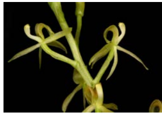
Liparis species Herkomst: Azië Cultuur: gematigd