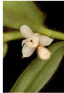
Trichotosia (Eria) pulvinata Herkomst: Zuid Oost Azië Cultuur: gematigd