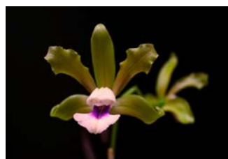
Cattleya tenuis Herkomst: Brazilië Cultuur: gematigd