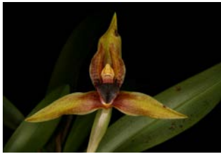
Maxillaria praestans Herkomst: Midden Amerika Cultuur: gematigd