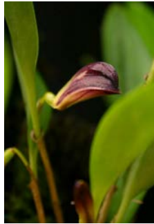
Zoötrofion atropurpurea Herkomst: Brazilië Cultuur: gematigd