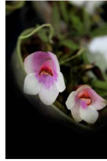
Dendrobium cuthbertsonii bicolor Herman ter Borch