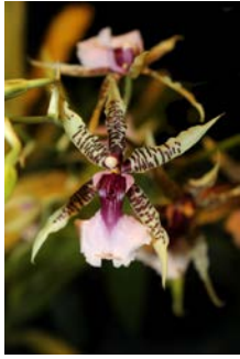
Oncidium hastilabium Patrick Cloes