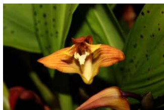
Maxillaria striata Patrick Cloes