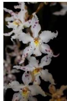
Oncidium alexandrae (Odontoglossum crispum) Patrick Cloes