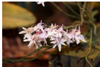
Dendrobium stellare Thei Schaareman