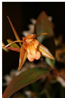
Coelogyne species Patrick Cloes