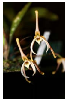
Maxillaria pseudoreichenheimianum Alex Nuijts