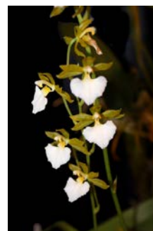
Rhyncostele bicktoniense semi alba Patrick Cloes