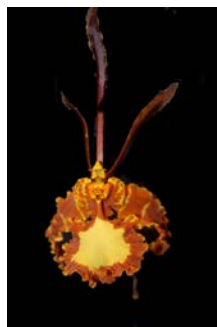
Psychopsis Kalihi Dorothy van Hoof