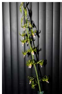
Eulophia euglossa Wim de Brons