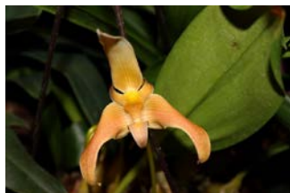
Bulbophyllum polystictum Maurice Castelyn