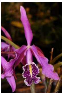
Cattleya maxima Thei Schaareman