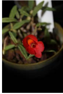
Dendrobium cuthbertsonii red Herman ter Borch