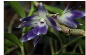
Dendrobium victoria-reginae Herman ter Borch