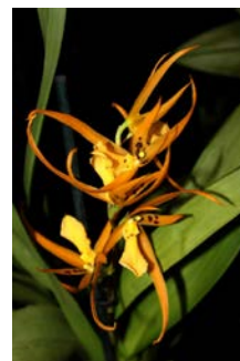
Bassada hybride Wim de Brons